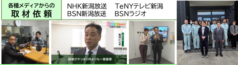
各種メディアからの取材依頼

新潟県が2019年度から実施している「にいがた健康経営推進企業表彰」において、弊社は、2024年度のグッド！スポーツカンパニー賞を受賞しました。この表彰は、県内で積極的に健康経営に取り組む企業「にいがた健康経営推進企業マスター」から、より顕著な成果を上げている企業を選定して表彰するもので、大変貴重な実績となります。