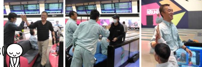
☆☆☆ 皆さんお疲れ様でした ☆☆☆