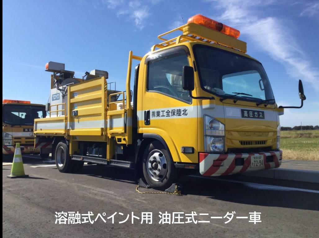
溶融式ペイント用 油圧式ニーダー車