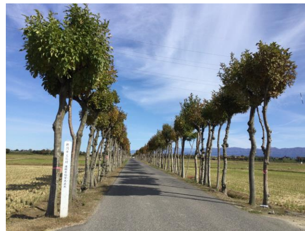
〈新潟市文化財 満願寺稻架木並木〉

いよいよ現場周辺に近づくと、新しい道路は走行できないし・・・どうやって現地へ行くのだろう！？という場面もありましたが、道なき道を経て無事現地に到着、施工班に合流できました。